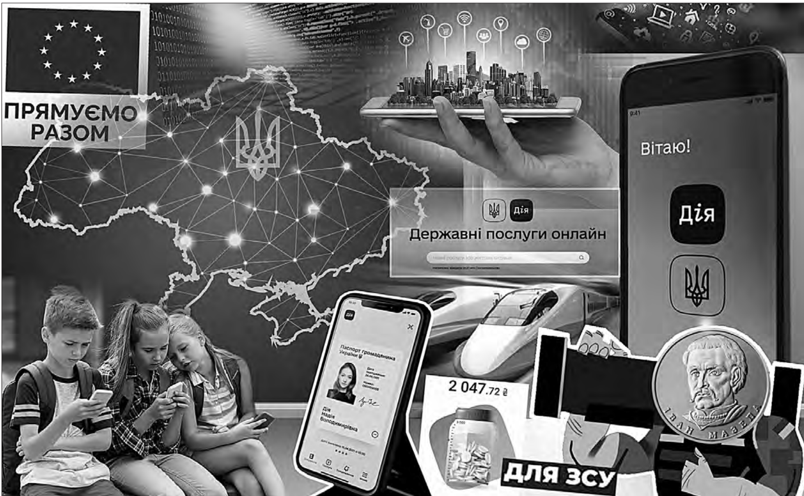
Колаж Олександра КУСТОВСЬКОГО.

Німеччина у межах військової допомоги уперше передала Україні сім розвідувальних безпілотників P11000 One, дальність польоту яких сягає 1 800 км. Як повідомила прес-служба уряду ФРН, до нового пакета також увійшли захисні системи AMPRS для гелікоптерів, 12 бронетранспортерів, два радари TRML-4D для ЗРК IRIS-T, PCB-принтер (3D), а також захисне та спецобладнання, зокрема п'ять надводних дронів, 10 тисяч безпекових окулярів та 32 термінали для супутникового зв'язку. Для логістичних цілей передано чотири великовантажні тягачі та чотири напівпричепа, а також 12 вантажівок типу MAN TGS. Крім того, українським військовим передали 30 тисяч комплектів зимового одягу. Також у німецькому уряді пообіцяли у майбутньому передати Україні 25 танків Leopard 1 A5. Цей проєкт реалізується спільно з Данією, повідомляє DW.